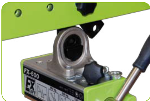
Schnell demontierbar zur Einzelverwendung